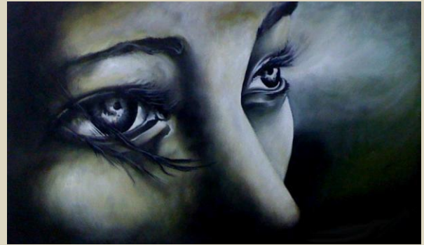
“Alma psique...2” Mario Sánchez M Óleo sobre lienzo. 30 x 50 cm 2013