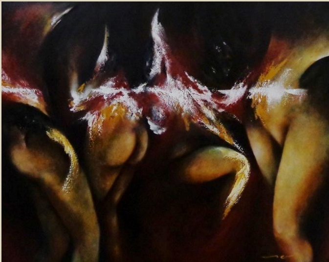
“Intermitencia” Mario Sánchez M Óleo sobre lienzo. 29 x 110 cm 2014