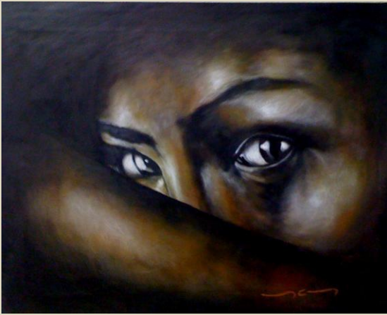
“Alma psiche...!” Mario Sánchez M Encausto sobre lienzo. 50 x 40 cm 2013