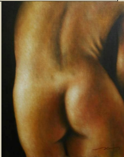
“Detalle...” Mario Sánchez M Óleo sobre tela 50 x 40 cm 2013